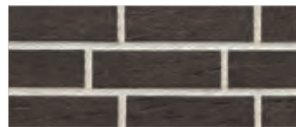
430 den haag 1)