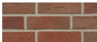
417 eindhoven 2)

Keraprotect® неглазурованная плитка 1) DIN EN 14411, Gr. AII 0 - часть 1 2) DIN EN 14411, Gr. AI 0