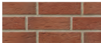
416 rotterdam 2)