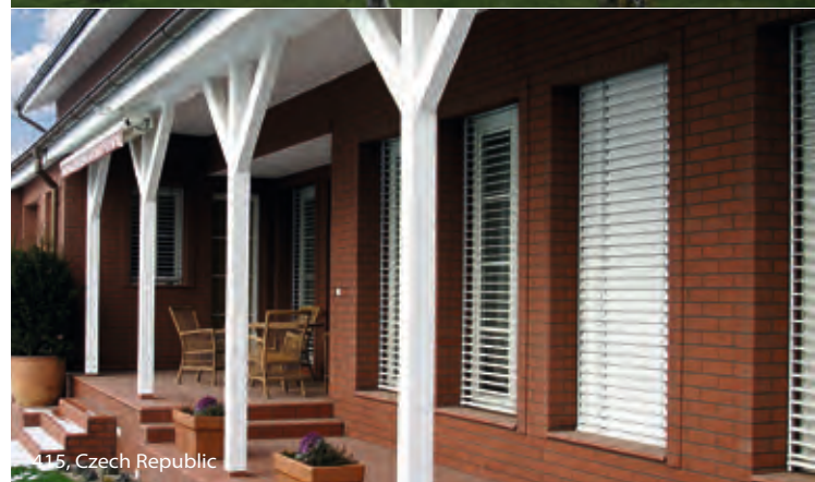
115, Czech Republic

Песчаная, шершавая как кожа акулы, поверхность этой плитки напоминает классический облик голландского кирпича-клинкера. Но данная оптическая составляющая далеко не единственное преимущество этой качественной керамики, прошедшей процесс обжига в туннельной печи. Как для нового строительства, так и при реставрации старых зданий, снова и снова возникает один и тот же вопрос - какова теплоотдача здания, облицованного тем или иным материалом? Достаточны ли показатели шумоизоляции? Долговечен ли продукт? Ответ очевиден – серия Keraprotect® обеспечит не только полный комфорт и уют, но и исключит дополнительные финансовые затраты.