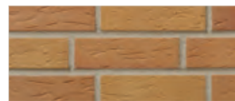
405 amsterdam 2)

Песчаная, шершавая как кожа акулы, поверхность этой плитки напоминает классический облик голландского кирпича-клинкера. Но данная оптическая составляющая далеко не единственное преимущество этой качественной керамики, прошедшей процесс обжига в туннельной печи. Как для нового строительства, так и при реставрации старых зданий, снова и снова возникает один и тот же вопрос - какова теплоотдача здания, облицованного тем или иным материалом? Достаточны ли показатели шумоизоляции? Долговечен ли продукт? Ответ очевиден – серия Keraprotect® обеспечит не только полный комфорт и уют, но и исключит дополнительные финансовые затраты.