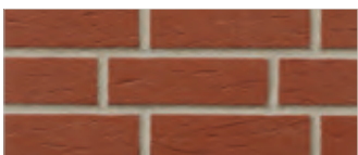
415 breda 2)