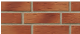
413 utrecht 1)